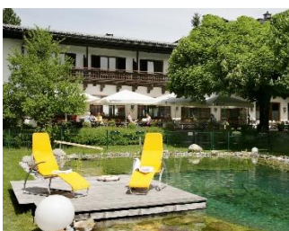
... und Naturbadeteich