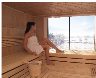
... mit Sauna