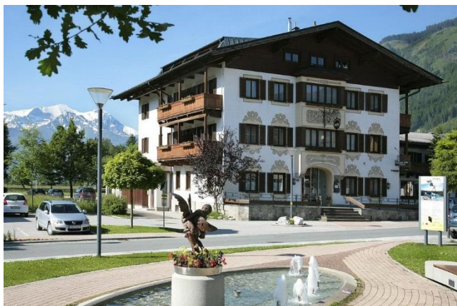
Gasthof zur Post in Maishofen