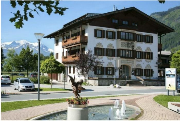
Gasthof zur Post in Maishofen