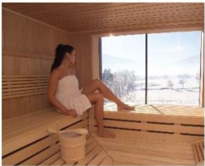
... mit Sauna