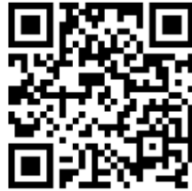
Zell am See / Kaprun