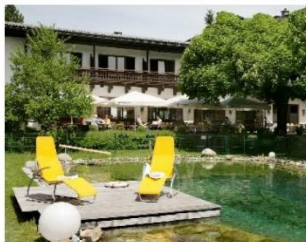
... und Naturbadeteich